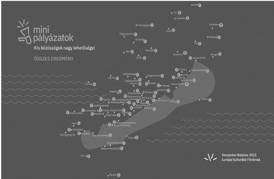
1. ábra: Minipályázat térbeli megoszlása Figure 1: Spatial distribution of the microgrants