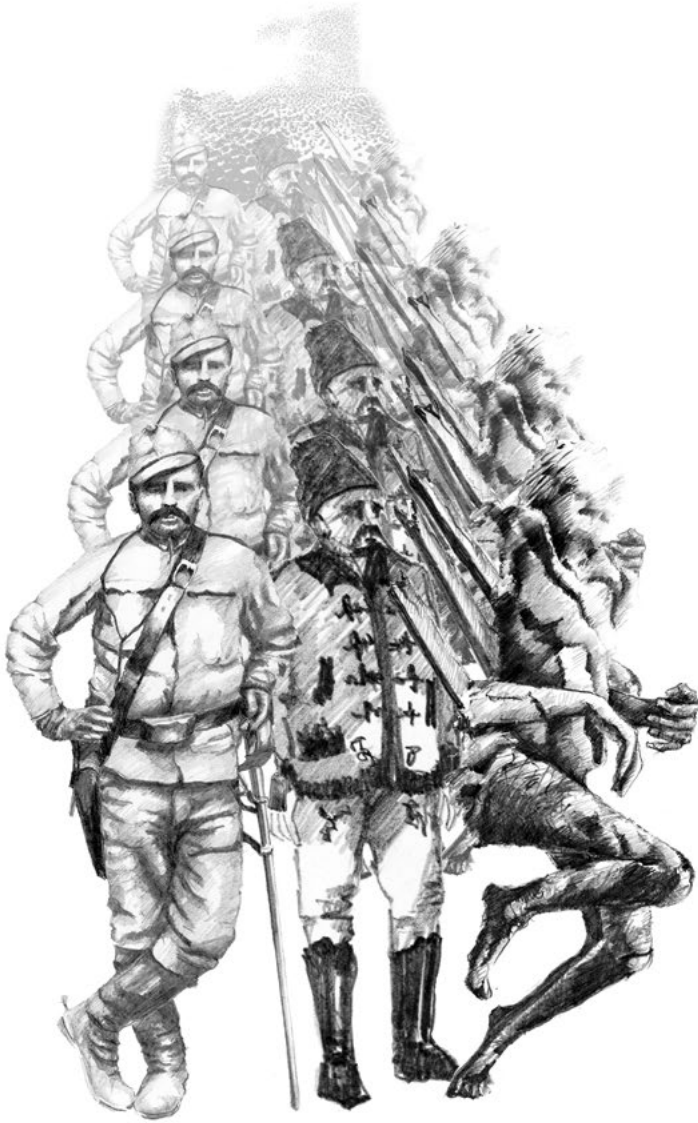
• Veszeli Lajos: Trianon utóélete 18 – ceruzarajz